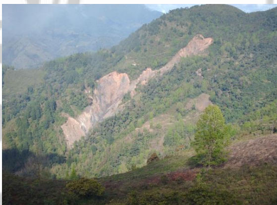
Fig. 3: Restauración Forestal en Honduras