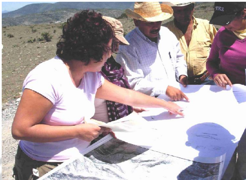
Fig. 9: Ubicando represas en Oaxaca