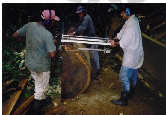
Fig.4: Apoyo a las microempresas madereras en Yoro (Honduras)