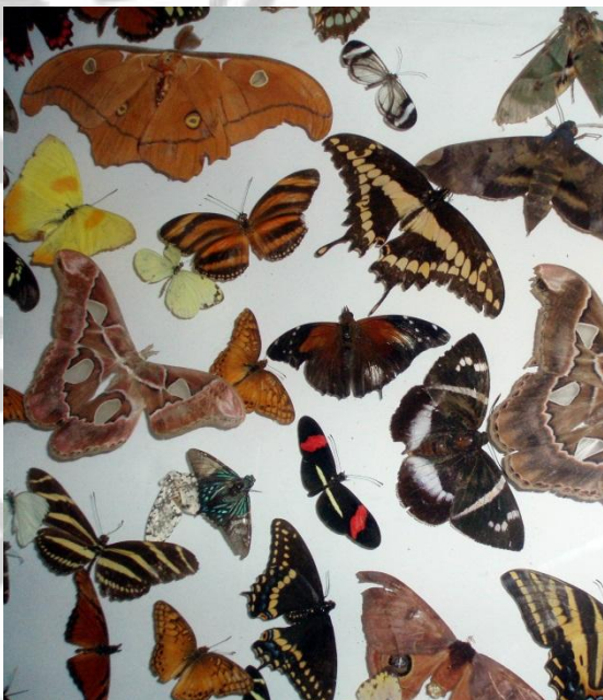
Fig. 7: Cultivo de mariposas en Honduras