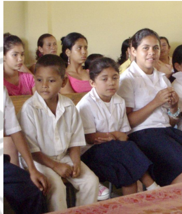
Fig. 6. Proyecto educativo de bachillerato agroforestal en Honduras