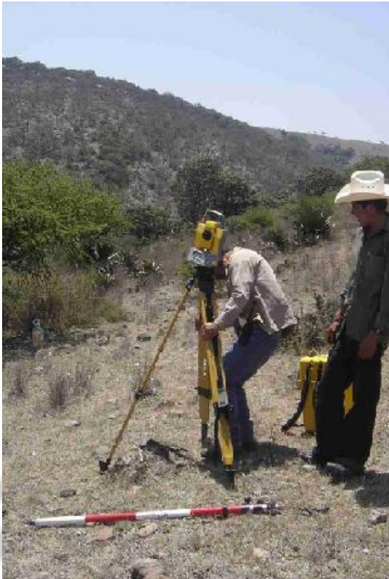
Fig. 5: Topografiando