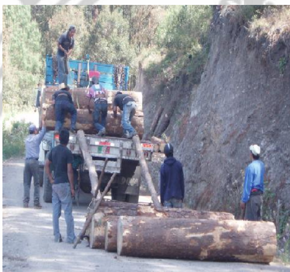
Fig 10: Cargando trozas en Oaxaca