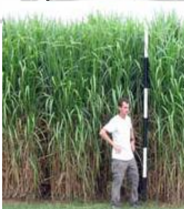
Fig.8: Cultivo del Miscanthus en Honduras